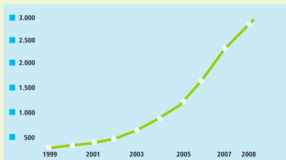
Umsatz FAIRTRADE-zertifizierte Produkte weltweit (in Mio EUR)